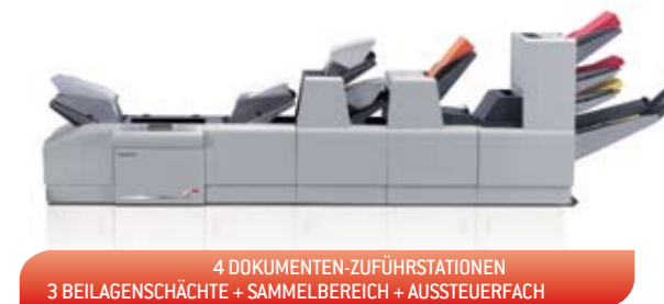
4 DOKUMENTEN-ZUFÜHRSTATIONEN 3 BEILAGENSCHÄLTE + SAMMELBEREICH + AUSSTEUERFACH