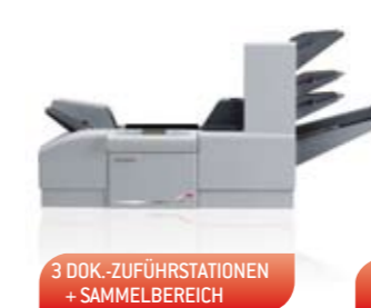
3 DOK.-ZUFÜHRSTATIONEN + SAMMELBEREICH

Durch den modularen Aufbau der DS-100 brauchen Sie sich bei der Anschaffung nicht den Kopf darüber zu zerbrechen, welche Anforderungen das System langfristig zu erfüllen hat. Erwerben Sie zur gegebenen Zeit einfach den richtigen Systembaustein hinzu – passend zum Wachstum Ihres Unternehmens. Diverse optionale Funktionen erschliessen Ihnen grössere Auftragsvolumen und steigern die Produktivität. Durch den modularen Aufbau des Systems ist die Kosteneffizienz Ihrer Anlageinvestition heute genau so wie in Zukunft gewährleistet.