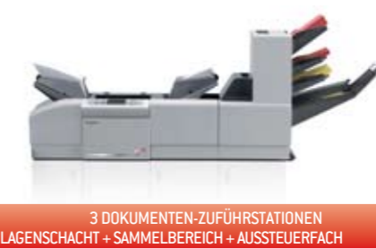
3 DOKUMENTEN-ZUFÜHRSTATIONEN 1 BEILAGENSCHACHT + SAMMELBEREICH + AUSSTEUERFACH